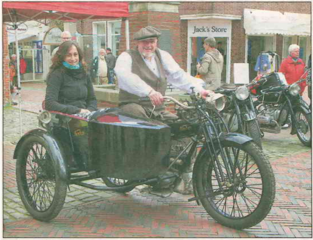
Man muss kein ausgesprochener Oldtimerfan sein, um an den vielen verschiedenen historischen Fahrzeugen Gefallen zu finden. Fast 400 dieser Vehikel sorgten im vergangenen Jahr für ein außergewöhnliches Bild in Jevers Straßen und auf den Plätzen.