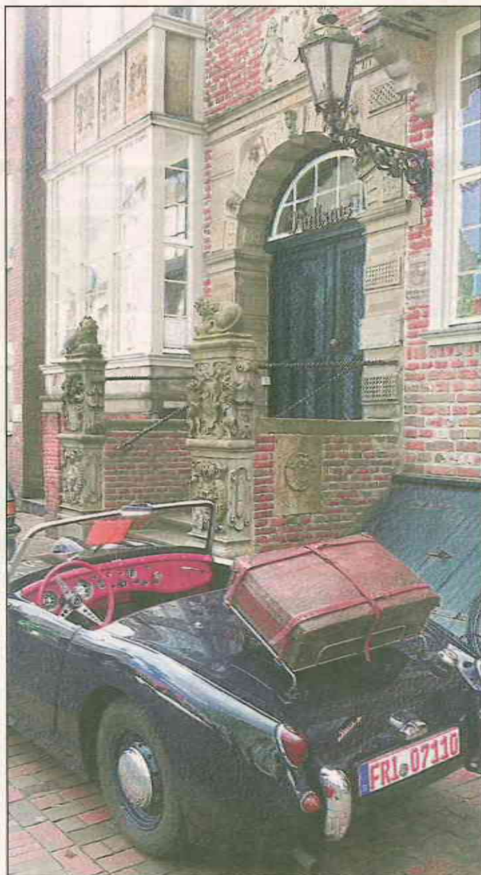
Auch vor dem historischen Rathaus von Jever macht sich dieser Oldtimer ausgesprochen gut.

Natürlich muss die Innenstadt am Sonntag für den Straßenverkehr gesperrt werden, denn die Oldtimer postieren sich entlang des von-Thünen-Ufers, am Sagenbrunnen, vor dem Schlosscafé und dem Schloss sowie auf dem Kirchplatz und anderen Plätzen. Hier verdient sich das Technische Hilfswerk, Ortsverband Jever, einmal mehr große Lob für die Absperrungen wie auch für die Arrangierung der Platzverteilung für all die schönen Oldtimer.